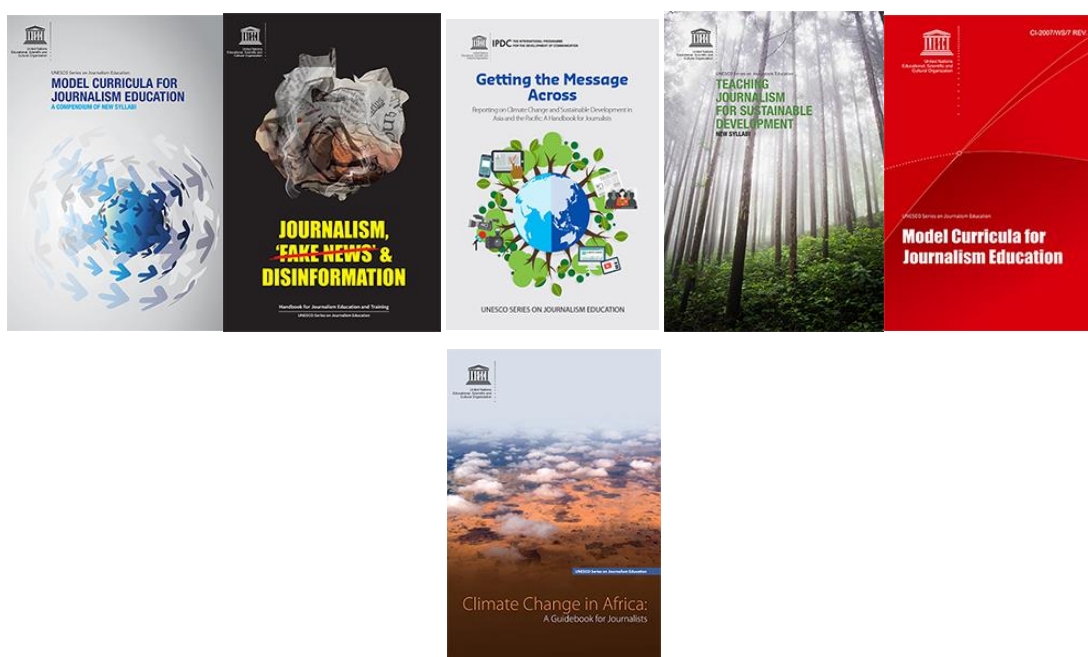
Figure 4 – Série UNESCO sur l'enseignement du journalisme

Les différents modèles de cursus et/ou de programmes ont été élaborés par des experts de toutes les régions, fers de lance de l'enseignement du journalisme. Ils sont disponibles dans plusieurs formats et plusieurs langues (voir la liste des versions disponibles en annexe 1) La série traite de multiples sujets, dont la désinformation, le traitement médiatique du changement climatique et du développement durable, les questions de genre, la migration et le terrorisme. Les couvertures de quelques ouvrages sont reproduites dans la Figure 4.